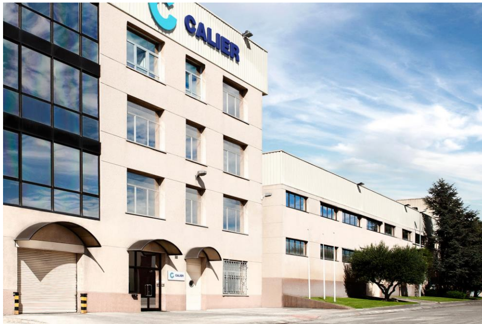
Sede de Calier en Les Franqueses del Vallès (Barcelona)

Con una facturación consolidada de 70 millones de euros, el 78% de las ventas de Calier provienen de mercados exteriores, principalmente de Europa y Latinoamérica (donde en la actualidad concentra el 39% de su negocio) y el 22% de España. Actualmente, su plantilla supera los 380 profesionales.